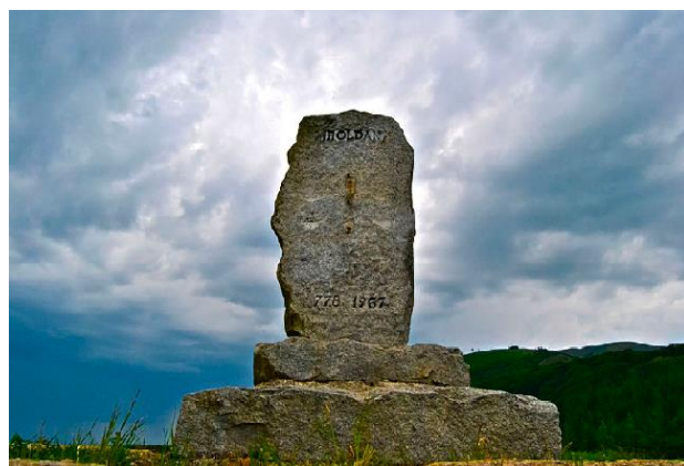
Ibañeta mendateko oroitarria. Orreaga.