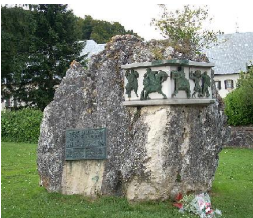
Orreagako guduaren oroitarria