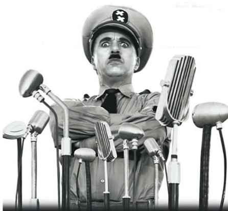
CHARLES CHAPLIN “ The great dictator ” (1940)